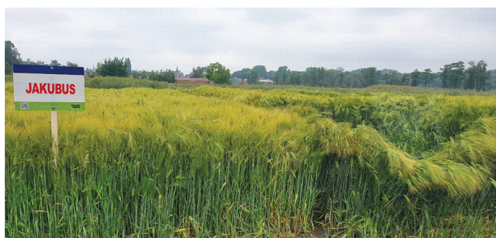
JAKUBUS - Odmiana o podwyższonej odporności na wyleganie